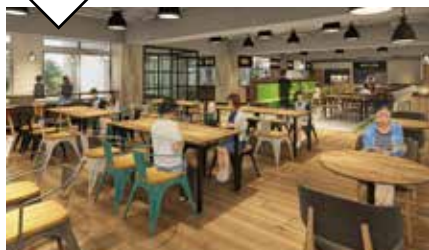
12号館 1F ラ・フォーレ