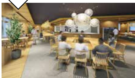
16号館 2F ふじかつ