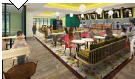
16号館 1F JOLIE (ジョリー)